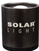
Standard Chassis - IP60 1.8" (45.8mm) High x 1.6" (40.6mm) Diameter