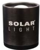
Standard Chassis - IP60 1.8" (45.8mm) High x 1.6" (40.6mm) Diameter