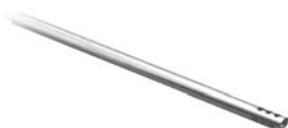
Model PMA2166K Stainless Steel Air/ Gas Probe 0.5" (12.7 mm) Diameter x 6.0" (152.4 mm) Long